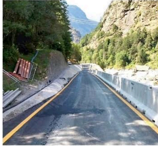
Uno dei tratti ripristinati della strada regionale tra Aymavilles e Cogne

Torna agibile anche il sentiero Alta via 2 Sostituito il ponte sul torrente Loson