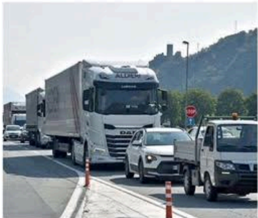
L'arrivo dei Tir sulla statale ha congestionato il traffico

85 dei valdostani sono i cantieri e anche senza e mezzi pesan- che code negli L'Anas, in vi- più caldo del- el Ferragosto, proprio ieri sura di tutti i eri sulla viabi- autostradale. tedi 3 settem- ore delle stra- «chiusura di i 70 per cento ttività. La beffa dell'Alta Val- antiere sul via- protardi reste- a mercoledì tico alternato; sio di Leverino a venerdì