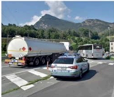
Le pattuglie della polizia controllano la situazione

A 28 giorni dall'alluvione, da questa mattina la carreggiata è percorribile da residenti e turisti Anche Valnontey può essere raggiunta attraverso una pista provvisoria con tratti sterrati